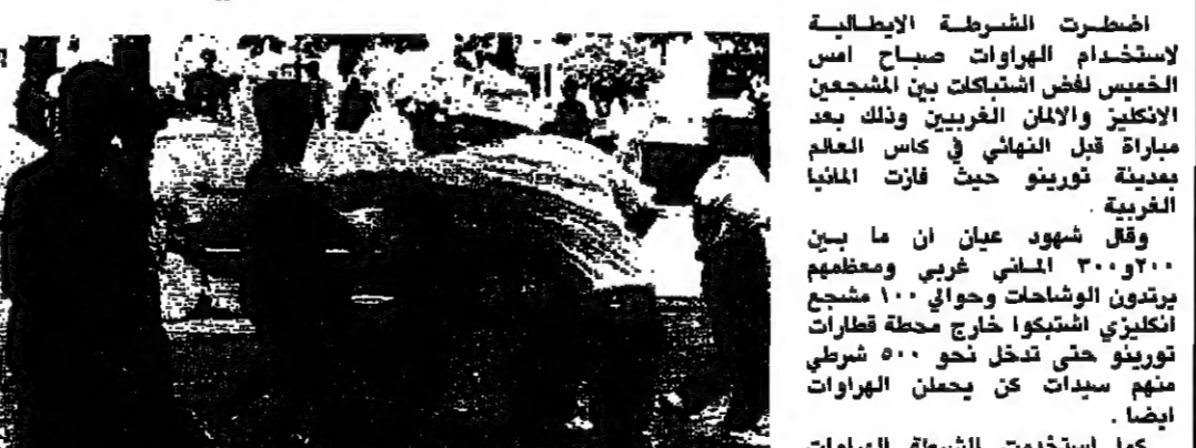
اشتباكات بين الألمان والانكليز

اضطرت الشرطة الهراوات صباح امس الخميس لضرب اشتباكات بين المشجعين الانكليز والألمان الغربيين وذلك بعد مباراة نهائي في كأس العالم بمدينة تورينو حيث فازت ألمانيا الغربية. وقال شهود عيان ان ما بين 30 و 40 المئات من المشجعين انكليز و 100 مشجع انكليزي اشتبكوا خارج محطة قطارات تورينو حتى تدخل نحو 500 شرطي منهم سيدات كن الهراوات أيضاً.